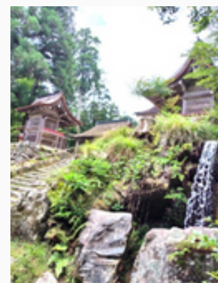
日吉大社 境内に流れる清流