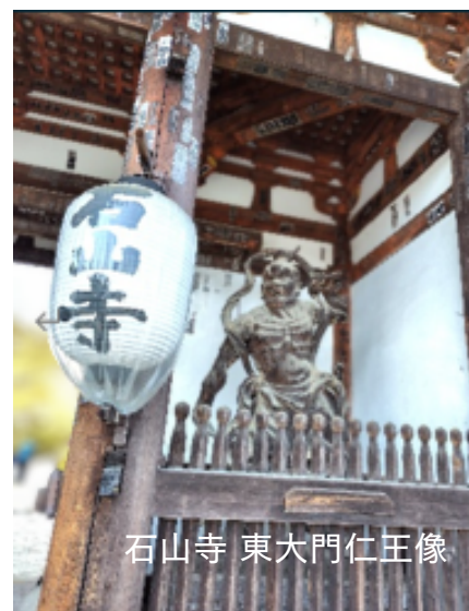
石山寺 東大門仁王像

タクシーの手配については、各クラブ・個人での対応をお願いします。大津市最大のタクシー会社は、大津第一交通株式会社です。タクシー107台、ジャンボ2台を保有しています。各社のホームページに詳細記載あり。タクシー情報はこちらにも参考に↓