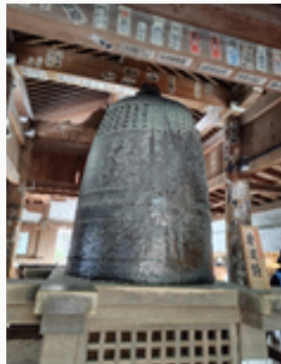
三井寺 弁慶の引き摺り鐘