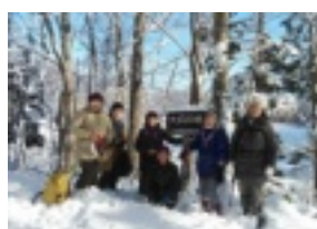
オオカメノキの冬芽も 元気でした！