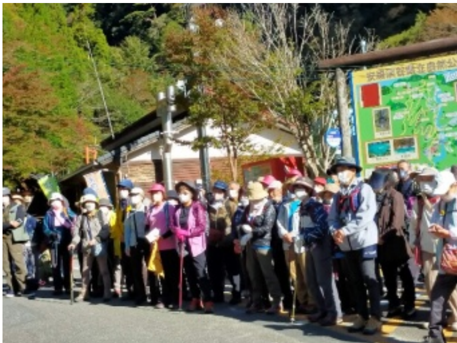
3年ぶりの交流ウォーク 全員集合！「開会式」

全国スポーツ祭典（中国・四国ブロック主管）の 第34回全国スポーツ祭典全国ウォーキングフェス ティバルが高知県にて開催されました。